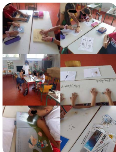
Εικόνες 13 & 14: Θερινά μαθήματα στο πρόγραμμα «Κατασκήνωση στην πόλη» του Δήμου Αγίας Βαρβάρας και στο 61ο ΔΣ Αθηνών