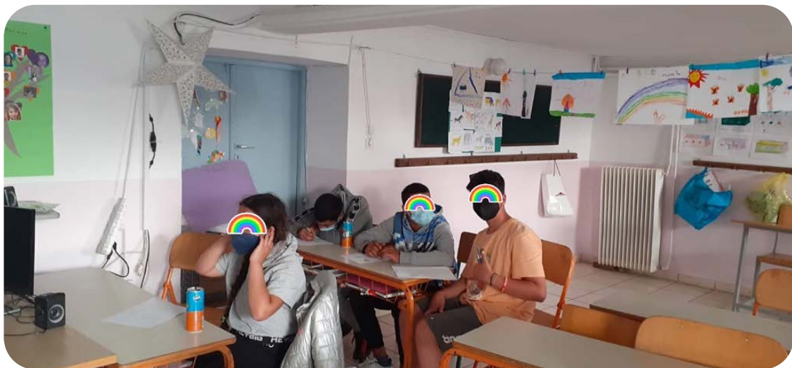
Εικόνα 1: Εμπυχτωτικές δράσεις στη Χίο