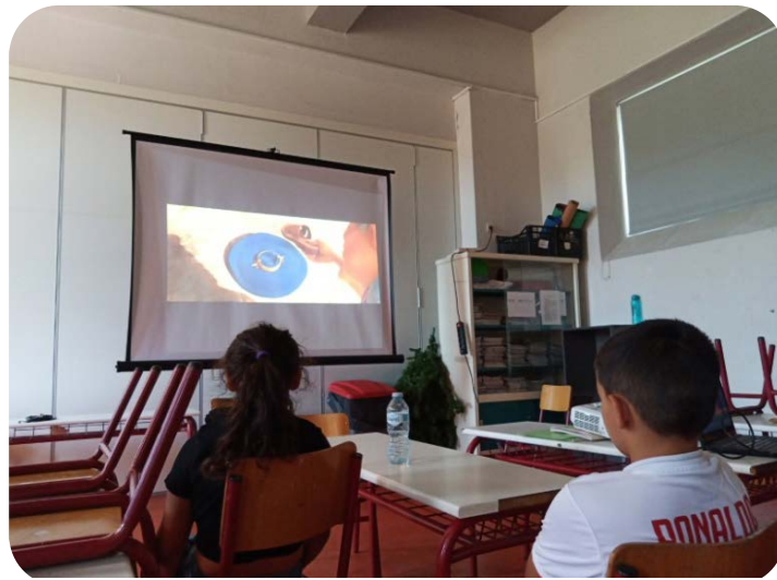
Εικόνα 7: Προβολή ταινίας στο 61ο ΔΣ Αθηνών