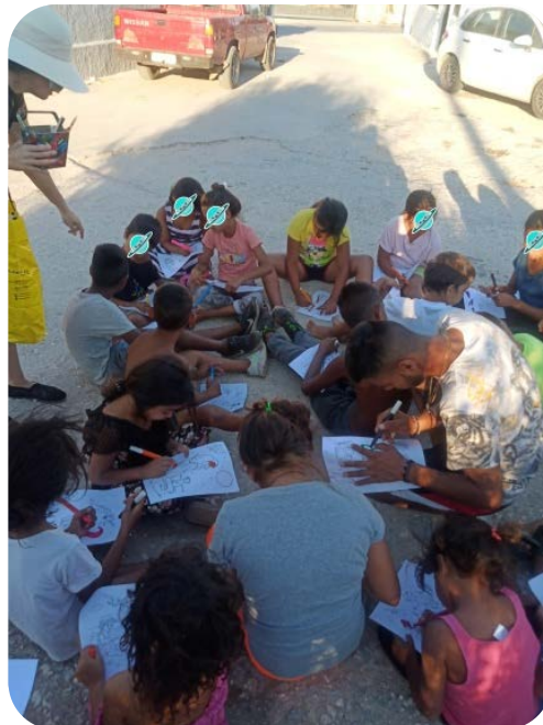
Εικόνα 4: Εμπυχωτικές δράσεις στον καταυλισμό Κούπι στο Κορωπί