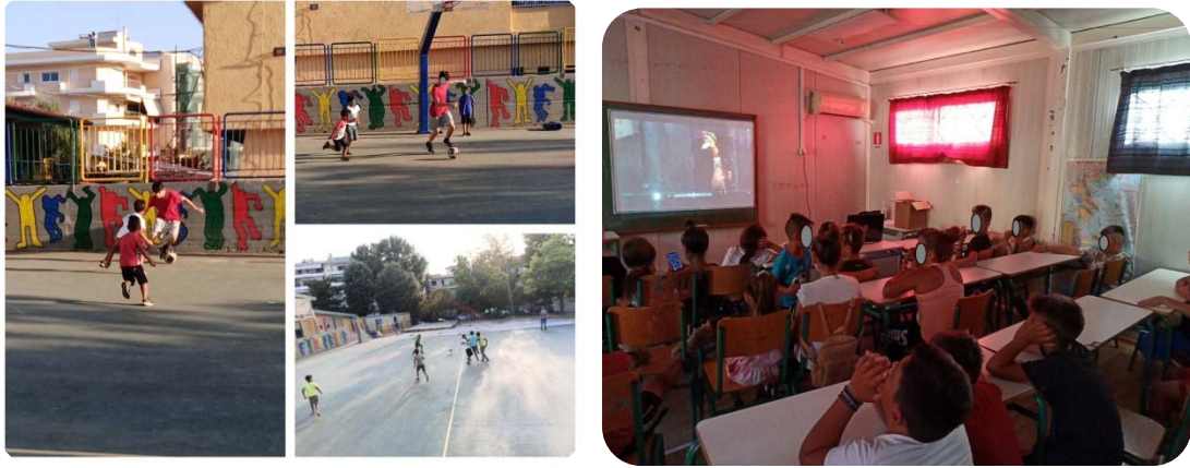
Εικόνα 2 και Εικόνα 3: Φιλικός αγώνας ποδοσφαίρου και προβολή ταινίας στο 1ο ΔΣ Γέρακα