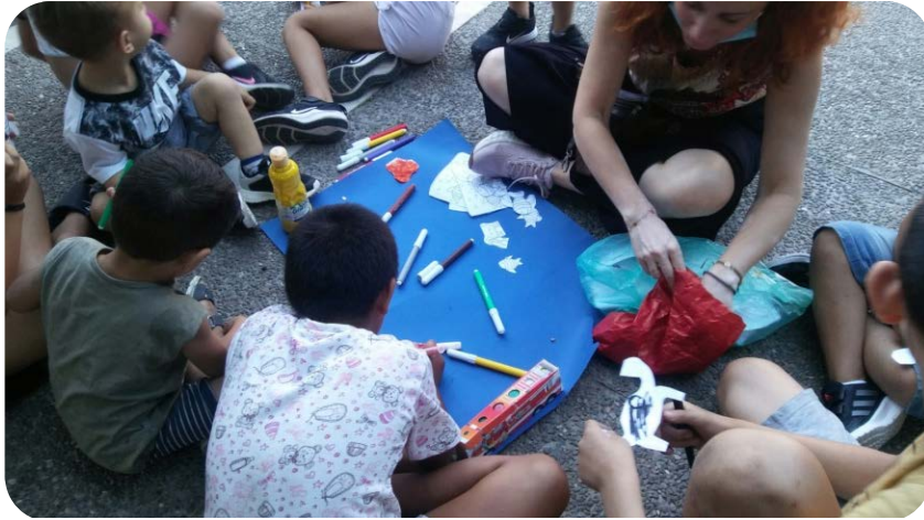
Εικόνα 6: Εμφυχωτικές δράσεις στην πλατεία Πέτρουλα στον Κολωνό