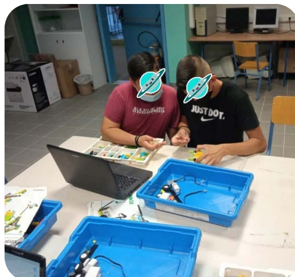
Εικόνα 5: Δράσεις ρομποτικής στο Εσπερινό Γυμνάσιο Χαλκίδας