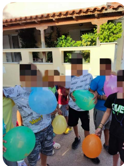
Εικόνες 8 και 9: Εμφυχωτικές δράσεις στις Καμάρες Ευβοίας